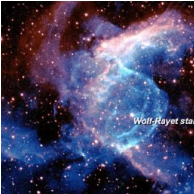
FIGURA 2: FOTOGRAFÍA DE UNA ESTRELLA TIPO WOLF-RAYET (EL PUNTO BLANCO RESEÑADO) RODEADA POR UNA CONCHA DE MATERIAL GASEOSO QUE SE CONOCE COMO NGC 2359. EL BRILLO DE LA NEBULOSA ES PRODUCTO DE LA LUZ ULTRAVIOLETA EMITIDA POR LA ESTRELLA, QUE LA ILUMINA. UN ASTRO COMO ÉSTE BIEN PUDO ESTALLAR COMO SUPERNOVA EN LAS CERCANÍAS DEL SOL CUANDO ÉSTE AÚN ESTABA EN FORMACIÓN, ENRIQUECIENDO EL SISTEMA SOLAR. (P. BERLIND & P. CHALLIS, HARVARD-SMITHSONIAN CENTER FOR ASTROPHYSICS).

respectivos viajes a través de la galaxia, perdiéndose el contacto entre ellos y relegando al olvido su pretérita historia en común. No obstante, por suerte no todas las estrellas presentes en un mismo cúmulo son iguales: las hay, por ejemplo, más o menos masivas, y en algunos casos lo son tanto que su interior no puede mantenerse estable por mucho tiempo; tras consumir rápidamente sus despensas de hidrógeno, el astro se colapsa sobre sí mismo y explota como una supernova.