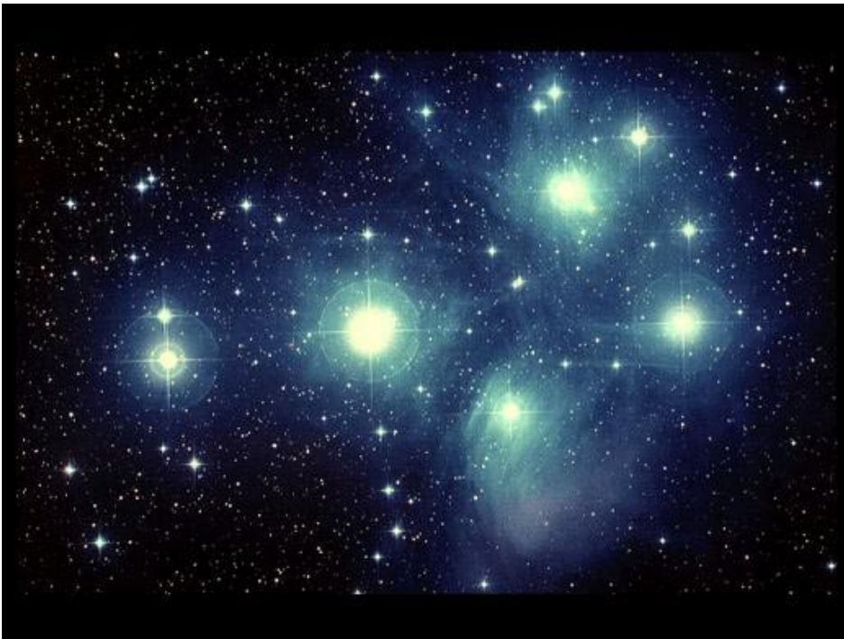
FIGURA 1: EL CÚMULO ABIERTO DE LAS PLÉYADES (M 45), EN LA CONSTELACIÓN DE TAURO. SE TRATA DE UN GRUPO MUY JOVEN DE ESTRELLAS, COMO LO DEMUESTRA LOS JIRONES DESHILACHADOS DE GAS QUE LAS RODEAN, PROCEDENTES DE LA NEBULOSA A PARTIR DE LA QUE SE HAN CONDENSADO. EL SOL Y SUS HERMANAS ESTELARES SE FORMARON EN UN ENTORNO SIMILAR HACE POCO MÁS DE 5.000 MILLONES DE AÑOS. (ROYAL OBSERVATORY EDINBURGH, 1985; DAVID MALIN)

Ahora bien, que a lo largo de su historia el Sol careciera de dicha compañía no significa que en el crisol donde se formó no estuviese arropado por el calor de otros iguales a él. Las estrellas, según sabemos, se condensan a partir del gas y el polvo presente en densas nebulosas, y nacen generalmente agrupadas en cúmulos que, lentamente, acaban por recoger (o dispersar) el material sobrante. Algunos ejemplos de cúmulos jóvenes aún poseen restos de la nebulosa original que les dio su sustancia material (figura 1).