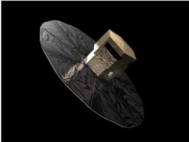
FIGURA 7: REPRESENTACIÓN DEL SATÉLITE GAIA, DE LA ESA, CUYO LANZAMIENTO EN 2011 PUEDE ABRIR UNA NUEVA ÉPOCA EN LA BÚSQUEDA DE LAS ESTRELLAS HERMANAS DE NUESTRO SOL. (ESA)

GAIA, de la Agencia Espacial Europea (ESA), previsto para 2011. Este satélite seguirá con gran precisión el movimiento de casi mil millones de estrellas; la huella que dejen en el espacio podrá ser empleada en rastrear sus movimientos pretéritos, incluso muchos millones de años atrás en el tiempo; por tanto, podrían obtener información muy valiosa de las hipotéticas estrellas hermanas del Sol.