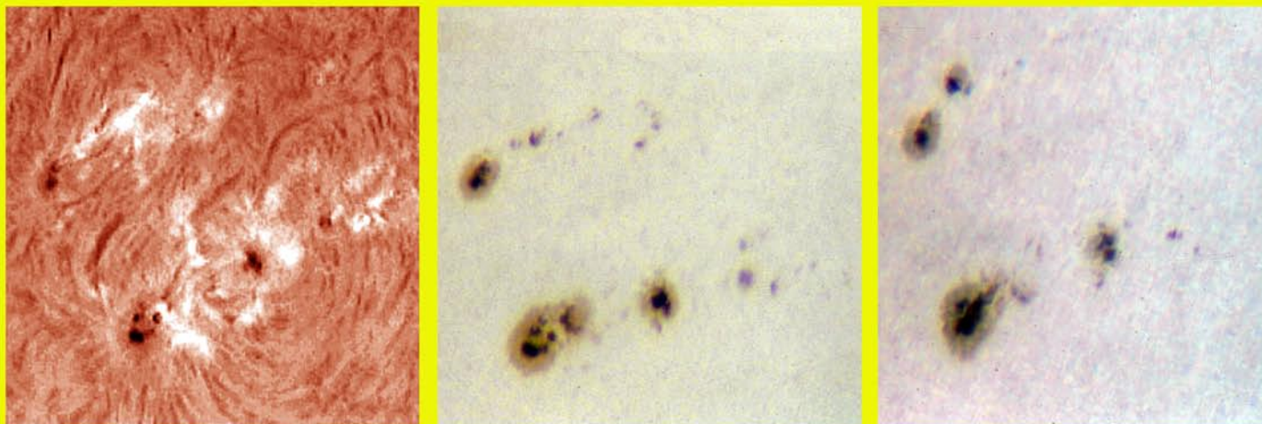
En aquestes imatges fetes el dia 21 de febrer (fotos 1ª i 2ª), podem observar els grups NOAA 1161 (baix) i el 1162 (dalt) a la cromosfera i la fotosfera respectivament, així com la seua evolució a l'endemà en la tercera imatge, tots dos a l'hemisferi nord. Imatges obtingudes a l'Observatori Astronòmic La Cambra a Ares dels Oms (València).