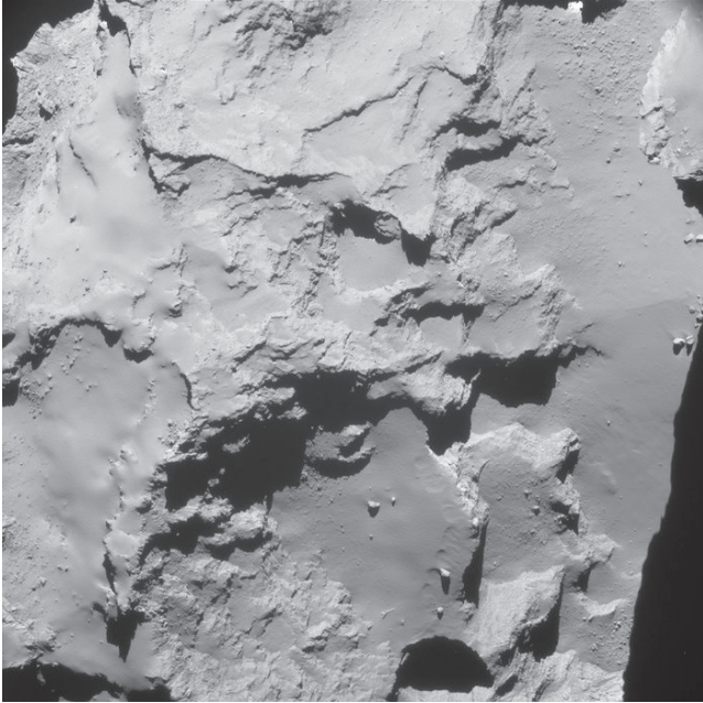
IMAGEN DE NAVCAM TOMADA EL 29 DE SEPTIEMBRE DE 2016 A LAS 22:53 GMT, CUANDO ROSETTA ESTABA A 20 KM DEL CENTRO DEL NÚCLEO DEL COMETA 67P / CHURYUMOV-GERASIMENKO. LA ESCALA EN LA SUPERFICIE ES DE APROXIMADAMENTE 1,7 m / PÍXEL Y LA IMAGEN MIDE ALREDEDOR DE 1,7 KM DE DIÁMETRO

Dos de las últimas imágenes tomadas por Rosetta, antes de terminar cayendo sobre su cometa el 3 de octubre.