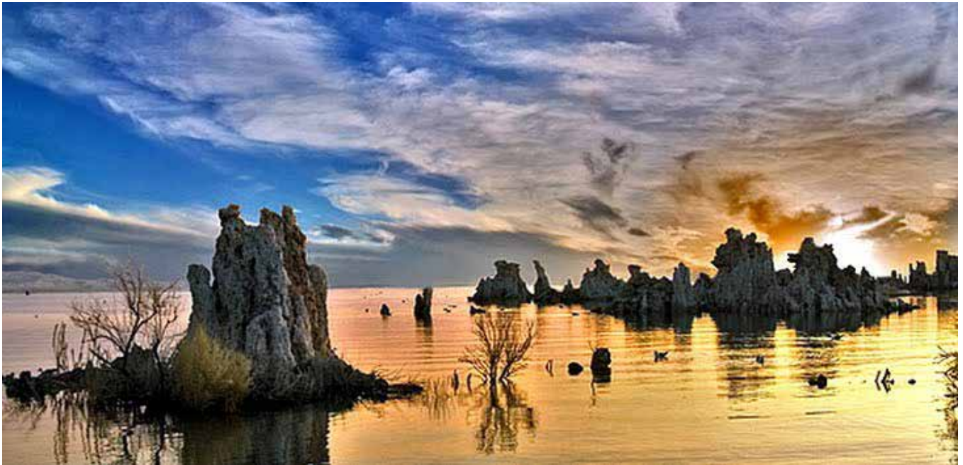
FIGURA 1.- El lago Mono (California). Aquí se encontró “la bacteria del arsénico”. Una bacteria que se creía muy distinta a la de todas las formas de vida conocidas, ya que parecía que se desarrollaba solo con arsénico. La revista Science ha publicado una investigación que acaba refutando esta afirmación ya que demuestra que también utiliza el fósforo.

abundantes en planetas rocosos, y posee una reactividad y propiedades similares al carbono cuando es sometido a bajas temperaturas. Tiene una serie de propiedades distintas al carbono que limitan mucho su capacidad para producir vida, pero se le suele considerar como la alternativa más plausible para la vida porque es el único elemento, además del carbono, que puede formar cadenas de átomos lo bastante largas como para codificar información biológica en su interior o, lo que es lo mismo, formar algún tipo de ADN (aunque sea muy simple) que permita a un ser vivo replicarse. Este tipo de ser vivo tendría un lento metabolismo y habitaría planetas muy helados.