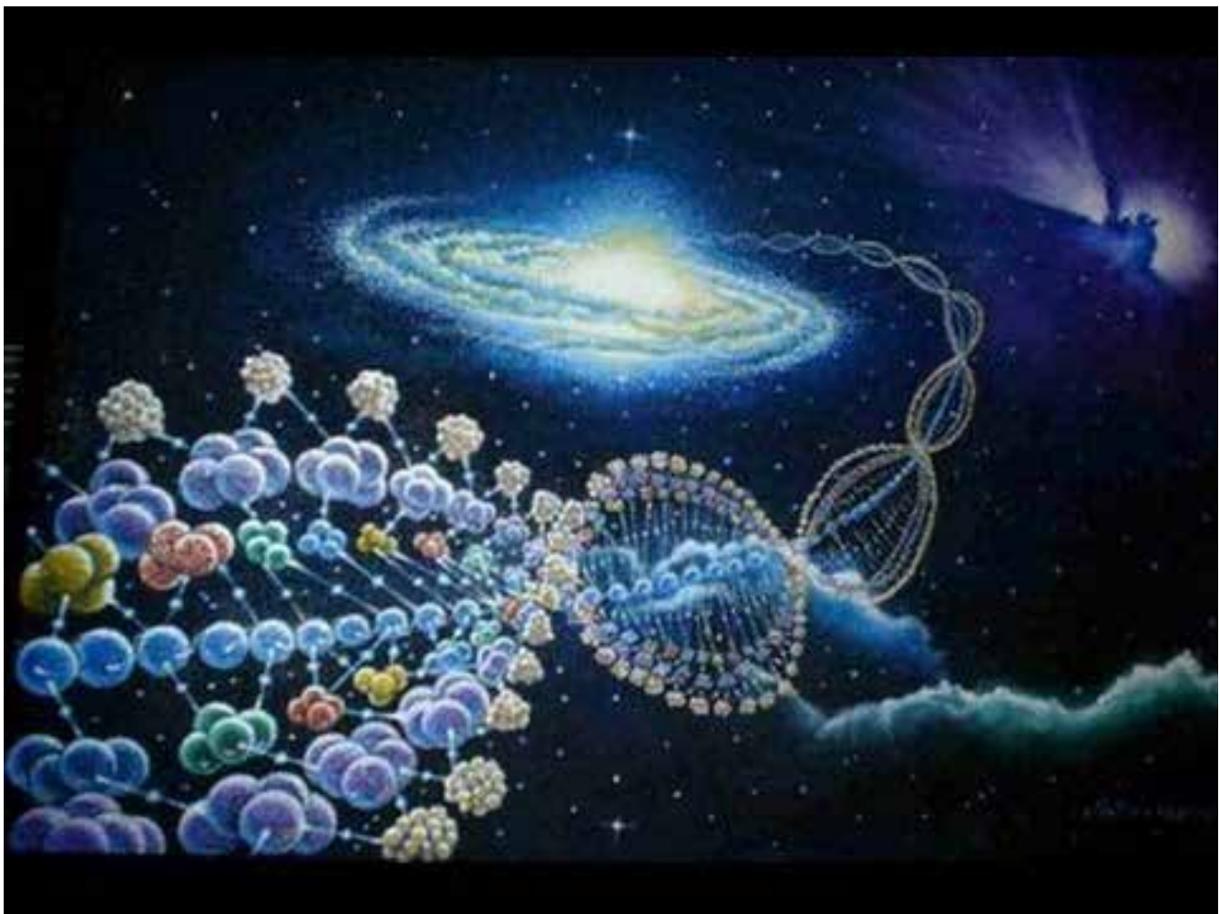
FIGURA 3.- RECREACIÓN DE PANSPERMIA. LA LLEGADA A LA TIERRA DE FORMAS MICROSCÓPICAS VIVAS QUE ALCANZARON EL PLANETA GRACIAS A LOS IMPACTOS DE METEORITOS Y COMETAS.

actuales convergen en un punto hace 3.800 millones de años, desde entonces parece que no ha habido seres vivos nuevos. Si hubo "intentos" anteriores es algo que nunca sabremos. Lo que sí sabemos es que los tres grandes dominios del árbol evolutivo: Bacterias, Arqueas (microorganismos extremófilos) y Eucariotas, tienen un antecesor común que vivió hace unos 3.600-3.800 m.a. Las Arqueas y las bacterias hipertermófilas son las parientes más cercanas a ese antecesor común, lo que prueba las condiciones existentes en la Tierra primitiva y como pudieron sin duda resistir los impactos de asteroides. Pero lo que tampoco sabemos es si ha surgido de